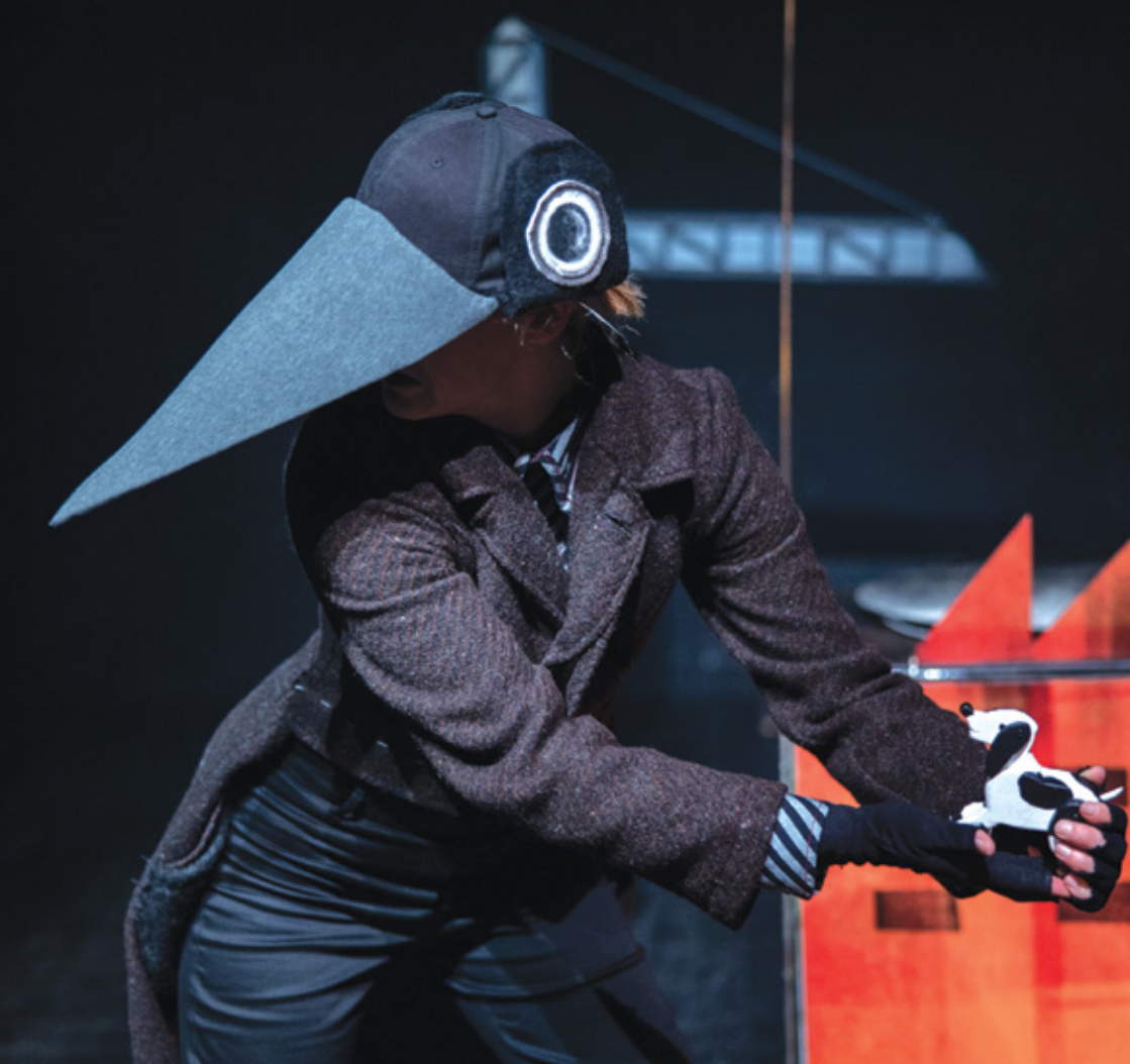
Ferdo, veliki ptić